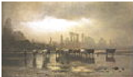
László Mednyánszky La adăpat