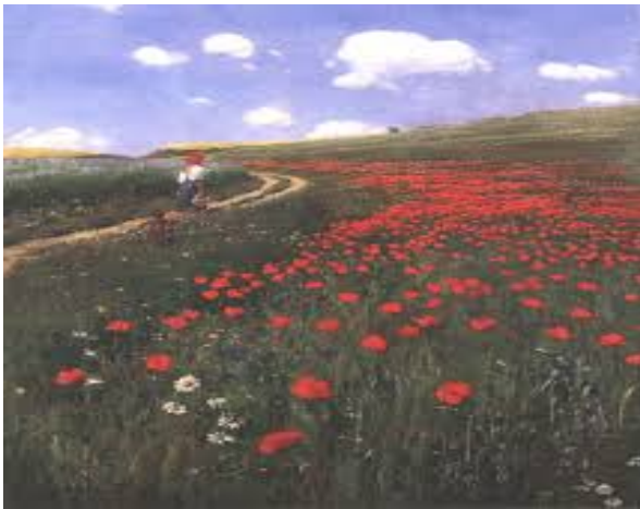
Szinyei Merse Pál – Printre maci