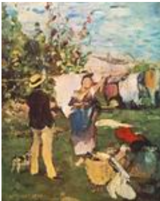
Szinyei Merse Pál – Uscatul rufelor

În societatea maghiară și românească de atunci astfel de subiecte însemnau o adevărată revoluție în gustul public și în mentalitatea publicului. Același lucru a fost într-o mai mică măsură și în Franța sau în Anglia, Germania, Austria, dar, acolo existând o clasă mijlocie cu o putere economică suficientă încât să-i permită și accesul la cultură, asemenea subiecte deveniseră acceptabile. În estul european vorbim despre nașterea artei laice, astfel încât publicul cerea ceva apropiat de ce considera el că este artă adevărată, adică neoclasicismul, respectiv academismul, cu personaje mitice și istorice, cu regulile clasice ale compoziției în pictură și sculptură.