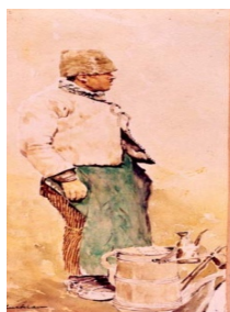
Ștefan Luchian – Bragagiul