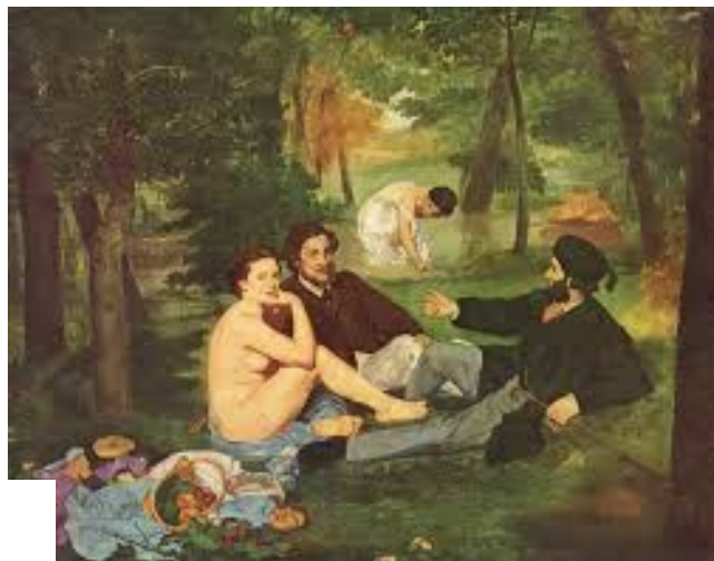
Edouard Manet - Dejunul pe iarbă