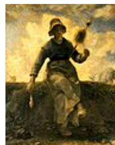
Jean Francois Millet – Torcătoarele