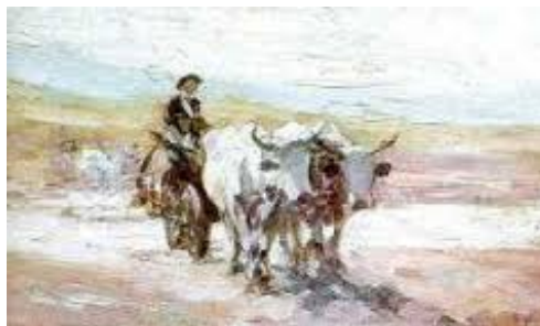
Nicolae Grigorescu Car cu boi

În alte două picturi una a pictorului maghiar, una a românului Grigorescu. se observă imediat aceeași temă, spațiul rural. Nu este o întâmplare, criticii de artă ai vremii remarcând faptul că artiștii est-europeni au rămas legați sufletește de spațiul copilăriei, că satul și oamenii săi rămân o sursă importantă de inspirație. Diferența cromatică nu afectează tehnica asemănătoare.