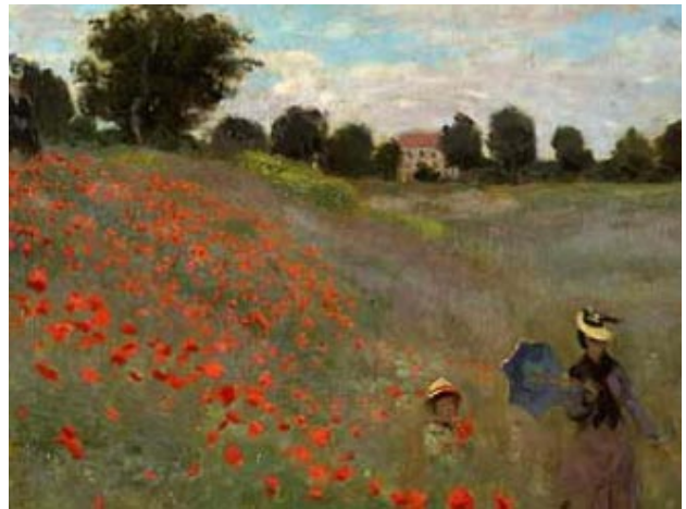
Claude Monet – Maci sălbatici

Atenția acordată oamenilor simpli se regăsește și la Szinyei, și la Ștefan Luchian. Rufele puse la uscat în grădină au fost sursa de inspirație pentru ambii pictori. Tehnica este a tușelor, iar culorile sunt puternice, pentru a scoate în evidență personajele. În ambele tablouri, datorită poziției personajelor, care stau cu spatele sau din profil față de privitor, impresia creată este aceea de instantaneu, de moment surprins rapid pentru a „opri clipa”.