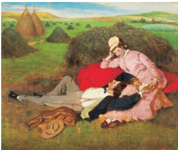
Szinyei Merse Pál –Îndrăgostiții

Ca și în cazul precedentului pictor, sunt evidente similitudinile cu alți pictori ai epocii. Astfel, Tablourile Picnic în mai , respectiv Îndrăgostiții ale lui Szinyei Merse Pál seamănă prin temă și tehnică cu Dejunul pe iarbă al lui Edouard Manet. În cazul lui Szinyei, îndrăgostiții au ca fundal un peisaj câmpenesc, deși personajele, prin vestimentație, fac parte mai degrabă din generația modernă. Mișcarea corporală a celor doi redând atmosfera relaxată. Culorile sunt destul de vii, roșul păturii și rozul rochei formând un echilibru față e verdele prospăt al câmpiei și galbenul șirelor de paie. „Picnicul în mai” este mai violent cromatic. Grupul petrecăreților se detașează clar pe fondul întunecat al ierbii. Personajele sunt de asemenea tineri de oraș, perechile fiind implicate în acțiuni diferite, existând și personaje izolate, cu ascunse atâtea celorlalți, cât și privitorului.