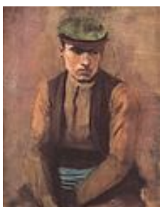
László Mednyánszky Zilierul

În alte două picturi una a pictorului maghiar, una a românului Grigorescu. se observă imediat aceeași temă, spațiul rural. Nu este o întâmplare, criticii de artă ai vremii remarcând faptul că artiștii est-europeni au rămas legați sufletește de spațiul copilăriei, că satul și oamenii săi rămân o sursă importantă de inspirație. Diferența cromatică nu afectează tehnica asemănătoare.