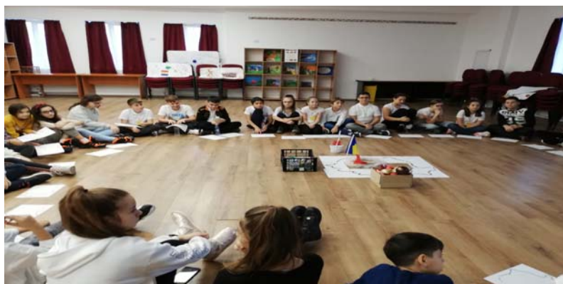
Ziua 1 Decembrie – Sunt român!

Din experiența la clasă am observat că activitățile extracurriculare au un rol important în îmbogățirea și fixarea cunoștințelor urmând principiul: „a învăța să înveți” și prin dezvoltarea competențele cheie stabilite la nivel european. Prin derularea proiectului „ Îmi pasă! ”, elevii și-au format priceperi, deprinderi, aptitudini, precum și interesul și dragostea față de țară și valorile sale culturale și artistice, prin recunoștința față de înaintași și față de cei care au făcut posibilă Marea Unire de la 1918.