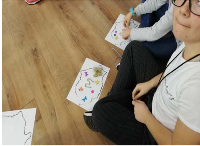
Metode creative de învățare