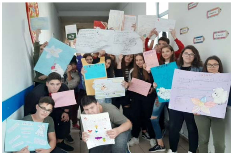
Prezentarea proiectelor elevilor altor clase.