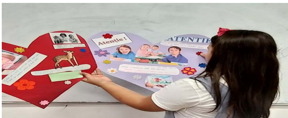
Proiect elev: „Trăsătura de caracter Atenția”